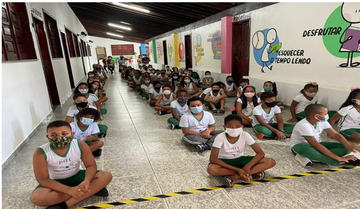
Alumni gruppo pomeridiano di giugno 2022