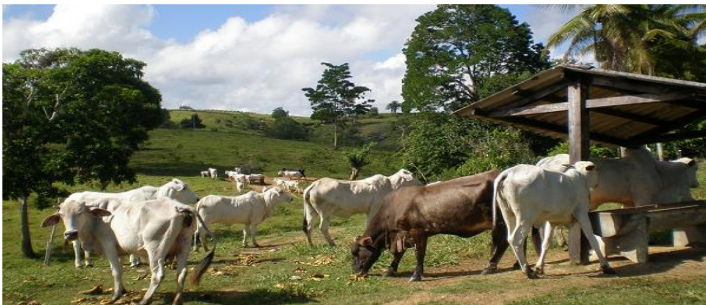
Amici - lavoratori della fazenda TABOR